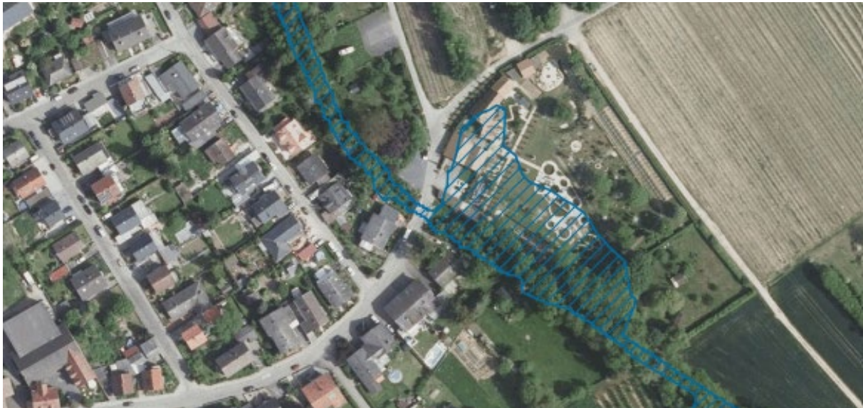
Abbildung 3: Gesetzlich festgesetztes Überschwemmungsgebiet innerhalb des Plangebietes

Bei der Prüfung sind auch die Auswirkungen auf die Nachbarschaft zu berücksichtigen.